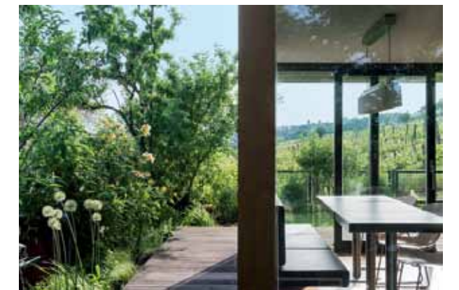
OBEN: Holzdeck als Südterrasse. GANZ OBEN: Sitzplatz für die Nachmittagssonne mit Rose 'Golden Celebration' in direkter Nachbarschaft zum Weingarten.

Haus und Garten bilden eine ideale gestalterische Einheit und sind ein gelungenes Beispiel für eine zeitgenössische Garten- und Hochbauarchitektur.